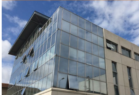
CABINET DE CONSULTATION CARDIOLOGIQUE - Bordeaux*