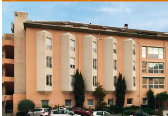
EHPAD Alzheimer - Bastia*

*Investissements déjà réalisés qui ne préjugent pas des investissements futurs.